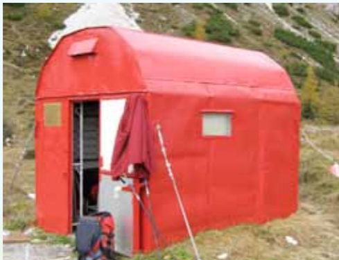
Bivacco Giusto Gervasutti (1940 m)