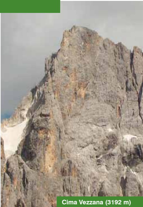
Cima Vezzana (3192 m)