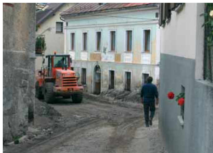
Le fotografie a sinistra raccontano le prime giornate di settembre 2003 e sono state concesse gentilmente dalla Redazione della Voce Isoncina.

Via Milacuzza, 5 Tel. 0431973100 Fax 0431973101