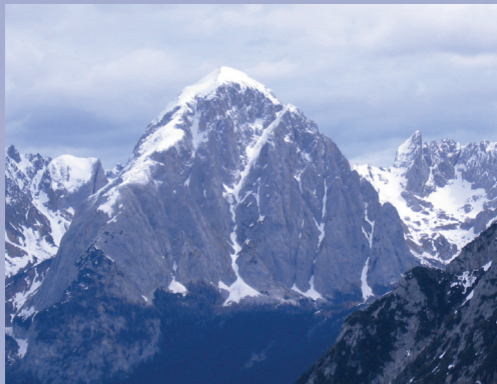
Monte Peralba (2694 m)