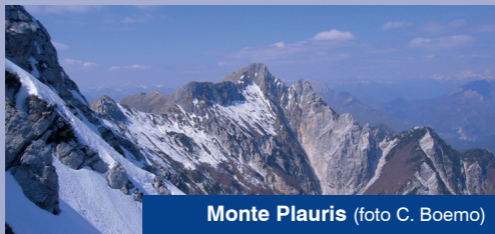
Monte Plauris