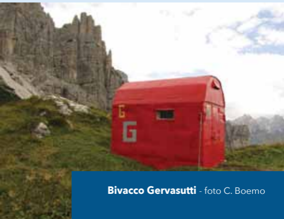
Bivacco Gervasutti