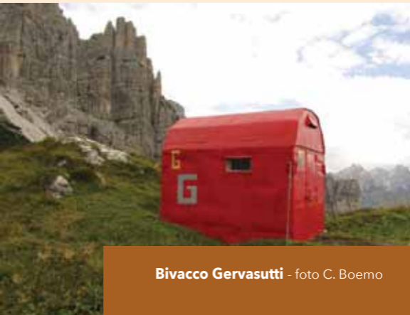
Bivacco Gervasutti