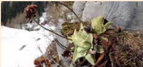
Primula odorosa - (foto Amici della Montagna)