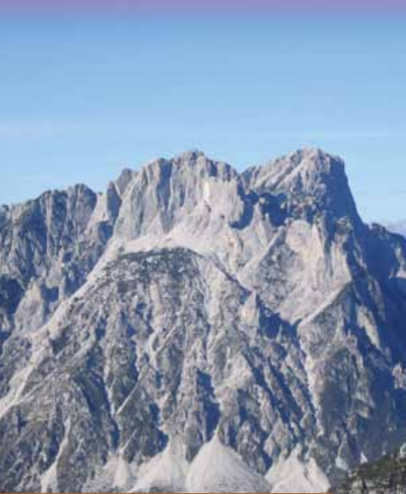
Creta Grauzaria e Sernio